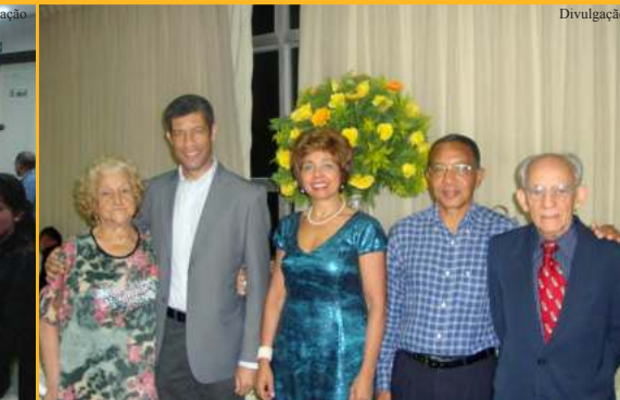
JUIZ DE FORA