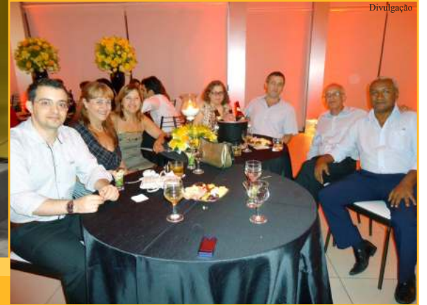
DIVINÓPOLIS (ANFIP-MG + DS)