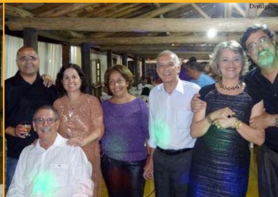
SETE LAGOAS (ANFIP-MG + DELEGACIA SINDICAL - DS)