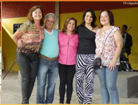
BARBACENA (ANFIP-MG + DELEGACIA SINDICAL - DS)