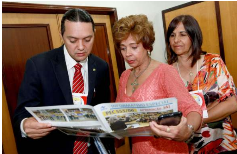
Gilson de Souza / IDT