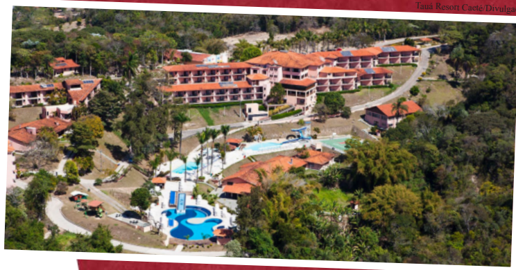
Tauá Resort Caeté/Divulgação

A ANFIP-MG tem a satisfação de convidar todos os associados para o VI ENCONTRO ESTADUAL DOS AFRFB APOSENTADOS E PENSIONISTAS, que será realizado entre os dias 13 e 16 de fevereiro de 2014, no Tauá Resort Hotel, em Caeté/MG.